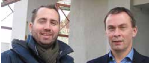
Politiegebouw veel duurder p.2