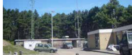
Toekomst militair domein p.1